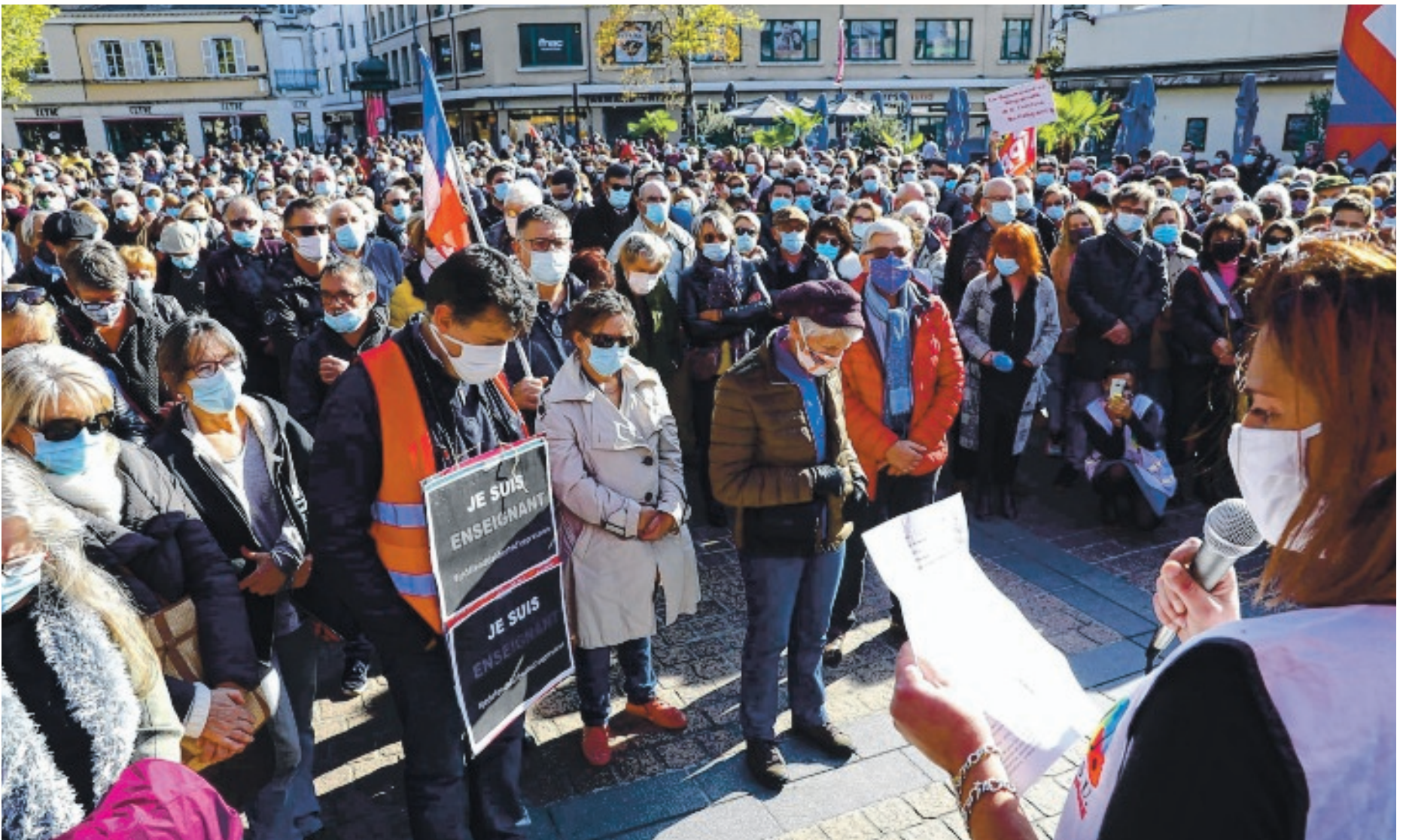
1.500 personnes à Châteauroux et 70 à Reuilly ont rendu hommage hier à Samuel Paty, professeur décapité par un terroriste, vendredi, dans les Yvelines.